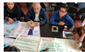
El ordenamiento espacial marino una prioridad para el Ecuador

Boletín N° 074 Guayas, 12 de febrero de 2019